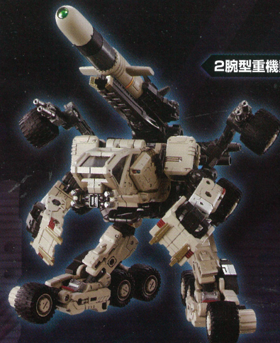
2腕型重機動マシン形態

決戦モードへの即時変形が可能な高速移動形態と機体を低重心化させ安定した格闘機動を行う2腕型重機動マシン形態がある。