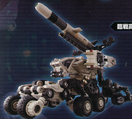
臨戦高速移動形態