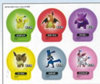
■ スタンドPOPシート × 1