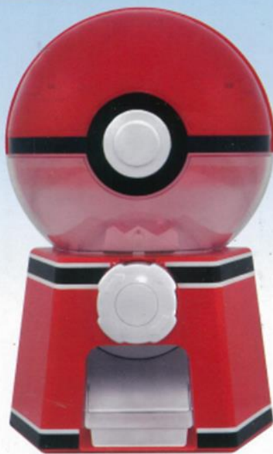
■ ガチャマシン本体 × 1