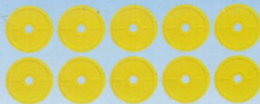
■ コイン × 10