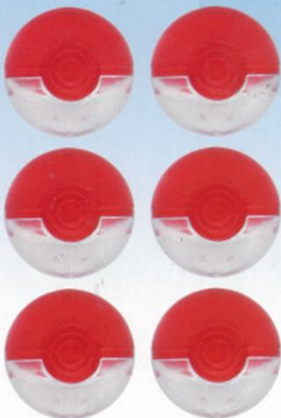
■ カプセル × 6