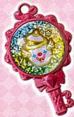
◆ひみつキー (オワライキー)