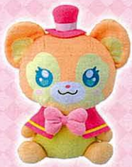
◆くまちい本体 (おしゃべりボックス内蔵)