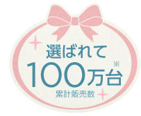
※シリーズ累計販売台数(当社調べ)

優しい光とぐっすりメロディで、 0ヶ月からの赤ちゃんの寝かしつけをサポート。 天井いっぱいにディズニーの夢の世界が広がる、 おやすみタイムにおすすめのホームシアター