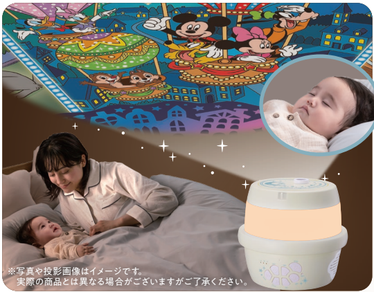
※写真や投影画像はイメージです。実際の商品とは異なる場合がございますご了承ください。

0ヶ月頃～大人まで 天井いっぱい! おやすみホームシアター ぐっすりメロディ&ライト ディズニーキャラクターズ 14,960円(税込) 単2形アルカリ乾電池4本使用(別売)