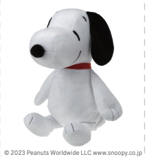
© 2023 Peanuts Worldwide LLC www.snoopy.co.jp