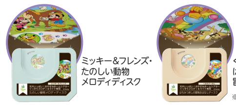
ミッキー&フレンズの たのしい動物 メロディディスク

0ヶ月頃～大人まで 天井いっぱい! おやすみホームシアター ぐっすりメロディ&ライト 専用 別売りディスク 各1,320円(税込)