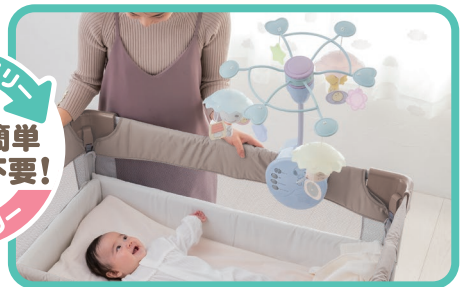
折りたたみベビーベッドメリー