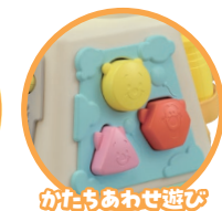
かたちあわせ遊び