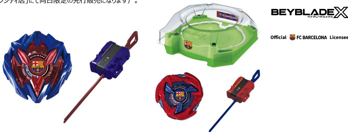
写真左)「UX-00 B4 スストア限定 スターター ドランバスター1-60A メタルコート：ブルー FCバルセロナ Ver.」

また、2024年12月1日(日)に、池袋・サンシャインシティ 噴水広場(アルパB1)で開催するブレイダーの頂点を決定する大会「 アジアチャンピオンシップ 2024 」にて先行発売(数量限定)が決定しました(「トイザらス・ベビーザらス 池袋サンシャインシティ店」にて同日限定の先行販売になります)。