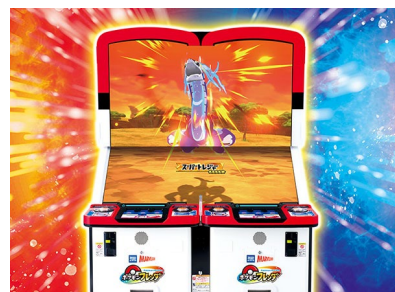
隣接の画面が繋がった大迫力のタッグバトル (※画像はイメージになります。)

画面に触れながらゲームを進めることで、映像の動きと操作アクションとの一体感が体感できる『ポケモンフレンダ』。今後も「タッチとフレンダでトレジャーゲット!」というキャッチコピーのもと、直感的で没入感のある遊び体験を提供してまいります。