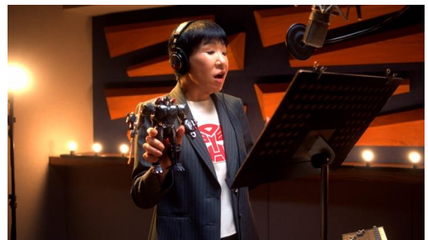
「トランスフォーマー/ビースト覚醒」玩具シリーズ テレビCM第2弾

株式会社タカラトミー(代表取締役社長：小島一洋/所在地：東京都葛飾区)は、変形ロボットキャラクター『トランスフォーマー』の実写映画最新作『トランスフォーマー/ビースト覚醒』(2023年8月4日(金)全国ロードショー)の公開に先駆けて、「トランスフォーマー/ビースト覚醒」玩具シリーズから主人公キャラクター“オプティマスプライマル”の決定版商品トランスフォーマー「ビースト覚醒 覚醒オプティマスプライマル」(希望小売価格：8,580円/税込)を2023年7月15日(土)から全国の玩具専門店、量販店等の玩具売り場、インターネットショップ、タカラトミー公式ショッピングサイト「タカラトミーモール」( takaratomy.jp )等にて発売します。また、タカラトミーモールでの予約受付は本日2023年6月8日(木)から開始します。