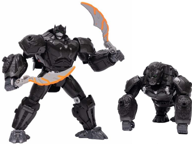
トランスフォーマー「ビースト覚醒 覚醒オプティマスプライマル」