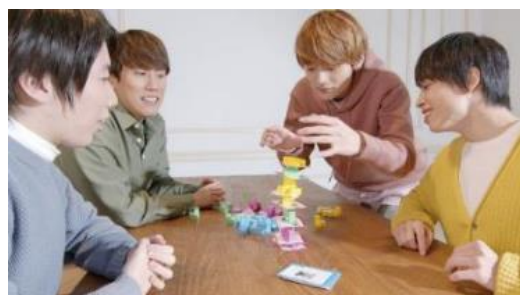
QuizKnockのメンバーが商品で遊ぶ様子

本商品を企画するにあたり、エンタメと知を融合したメディア「QuizKnock」の「楽しいから始まる学び」というコンセプトに共鳴し、監修をいただくことになりました。各ゲームのルールやゲームバランスの調整、使用する能力などの設定にあたり、「QuizKnock」のメンバーの“東大脳”を存分に発揮していただきました。