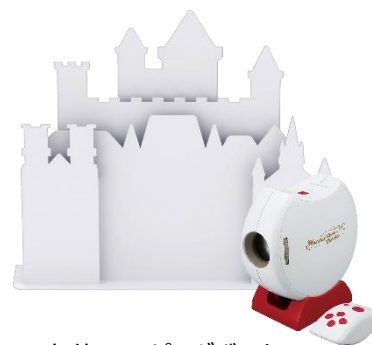
本体とマッピングボード