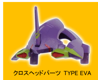
クロスヘッドパーツ TYPE EVA