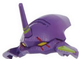
第2形態用ヘッドパーツ

ロボットモード時には、“EVA初号機”の頭部デザインをイメージした新規造形の“第2形態用ヘッドパーツ”を装着させることで“シンカリオン 500 TYPE EVA 第2形態”（※2）を再現することができます。