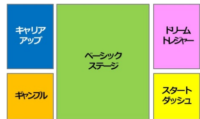
③全部詰め込んだ フルボリューム