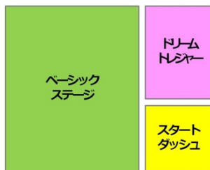
①夢いっぱいな 甘口テイスト