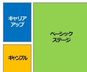
②波乱万丈な 辛口テイスト