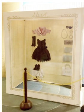
パッケージ型フォトスポット