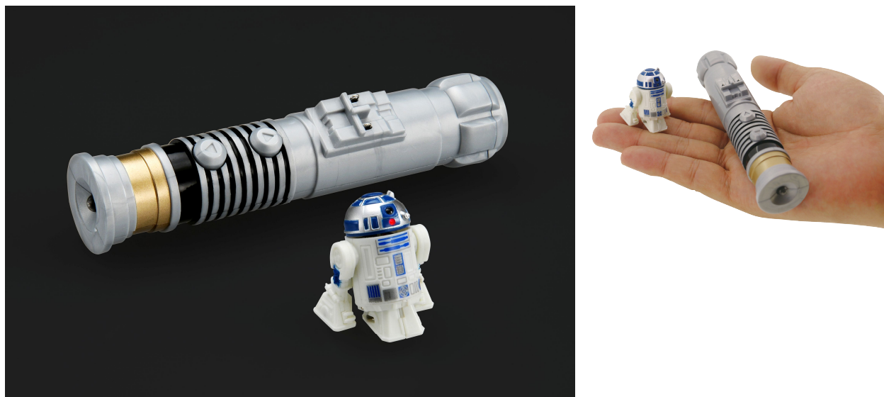
「スター・ウォーズ ナノドロイドR2-D2」

「R2-D2」は、これまでの映画「スター・ウォーズ」シリーズ6作すべてに登場するドロイド（ロボット）で、2015年12月18日公開予定の『スター・ウォーズ／フォースの覚醒』にも出演が決定しています。