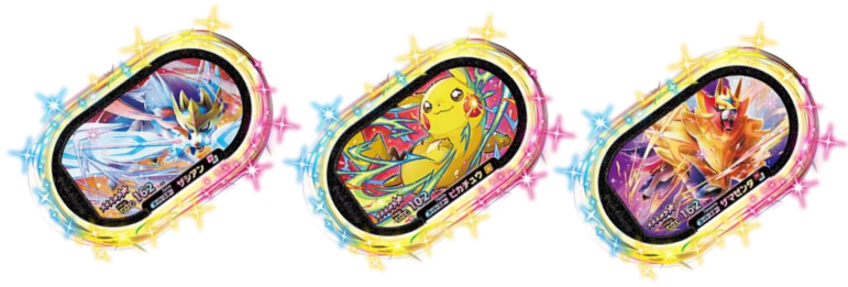
配出物(提供物)『タグ』