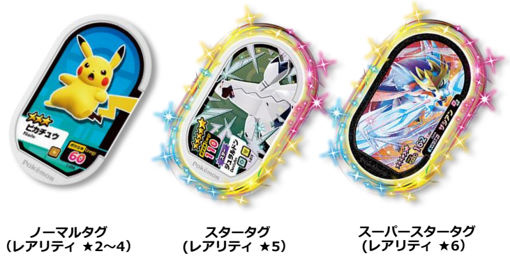
ノーマルタグ (レアリティ ★2~4)

さらに「タグ」には★のレアリティがあり、「スターポケモン(★5)」または「スーパースターポケモン(★6)」の「タグ」には「キラ加工」が、最高ランクの「スーパースターポケモン」の「タグ」には「迫力あるイラスト」がデザインされ、タグの色もクリアラメ成型の豪華な仕様となっています。