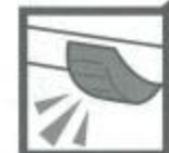
チャージホイール