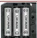
単3形アルカリ乾電池3本