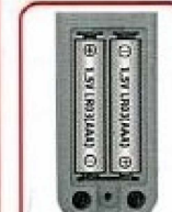
単4形アルカリ乾電池2本