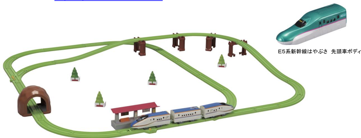
E5系新幹線はやぶさ 先頭車ボディ