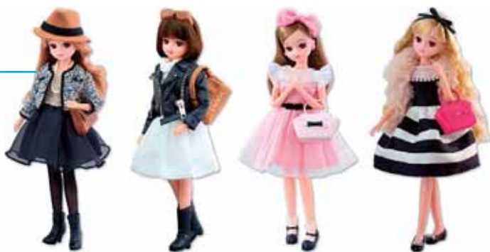
リカビジュシリーズ