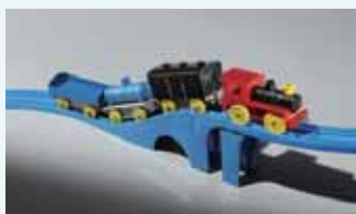
プラスチック汽車・レールセット