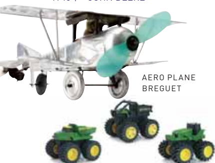
AERO PLANE BREGUET