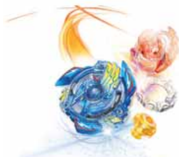
ベイブレードバースト