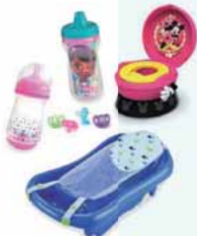
THE FIRST YEARS