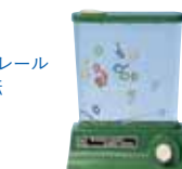
ウォーターゲーム