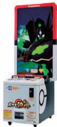
ポケモンガオーレ