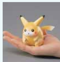
ポケットモンスターシリーズ