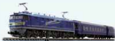
TOMIX JR東日本商品化許諾済